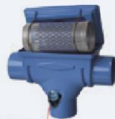
Rappeling "Back Wash" system Raccord système "Back wash"