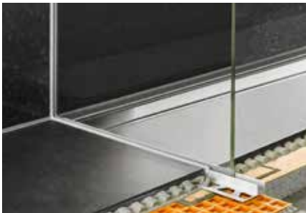
Inbouw in de douche met een glaselement