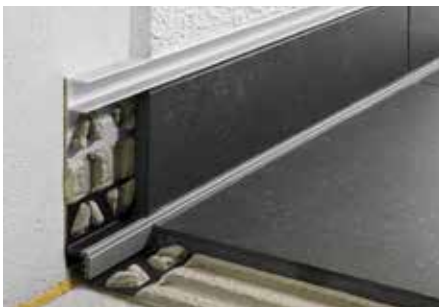
Inbouw aan een plint