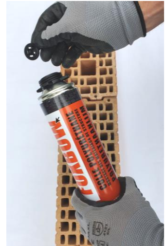
1. Verwijder de afsluiting