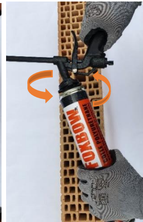
3. Schroef het applicatorpistool vast en pas het debiet aan de achterkant van het pistool aan